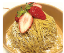
2 お菓子の蔵 太郎庵 ゆうやけベリーと会津栗のモンブラン

菓子コーナーには県内30社以上のおいしいお菓子が勢ぞろい。ふくしまの新しいいちご「ゆうやけベリー」を使用した商品も充実し、会場内での実演販売やイトインも楽しめます。