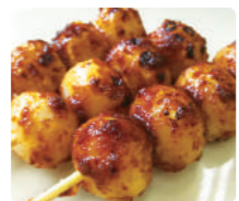
4 宝来堂製菓 焼きだんご