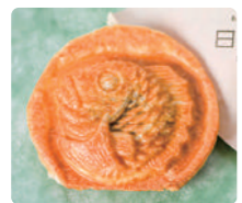
3 あんことおはぎ日々館 福々たいやき