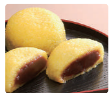
5 小池菓子舗 あわまんじゅう